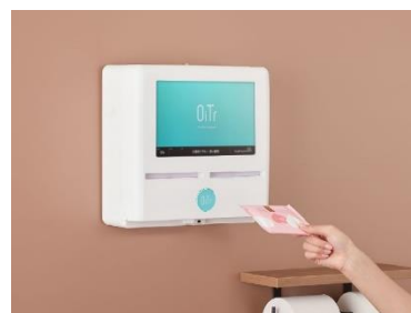
<「OiTr」ディスペンサーイメージ>

「OiTr」は、オイテル株式会社による、商業施設・オフィス・学校・公共施設などの個室トイレに生理用ナプキンを常備し無料で提供する日本初のサービスで、専用アプリは30万ダウンロード（2022年8月16日時点）を突破しています。利用者は、個室トイレ内の壁に掲示してあるQRコードをスマートフォンで読み取り、OiTrアプリ（無料）をダウンロード。アプリを起動してディスペンサーに近づけることで出てくる生理用ナプキンを利用いただけます。