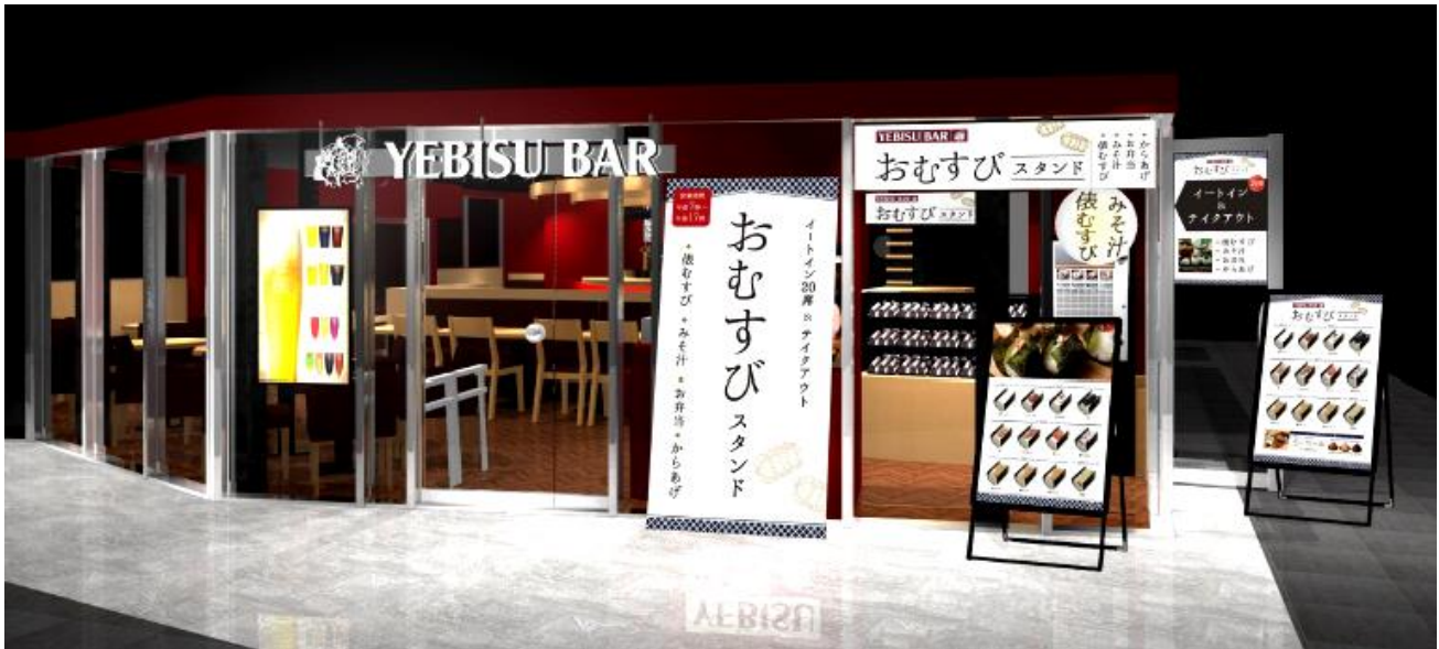
＜「YEBISU BAR」店舗イメージパース＞

また、2021年6月のリニューアル第2弾では、本厚木エリア初のフードホールとなる「f L D K (エフ・エル・ディー・ケー)」がオープン予定です。「f L D K」には「食を通じて生活を豊かにする」という意味が込められており、豊富なラインナップの食事を1つの空間で全てお召し上がりいただけるフードホールを創出します。