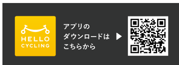
専用アプリQRコード